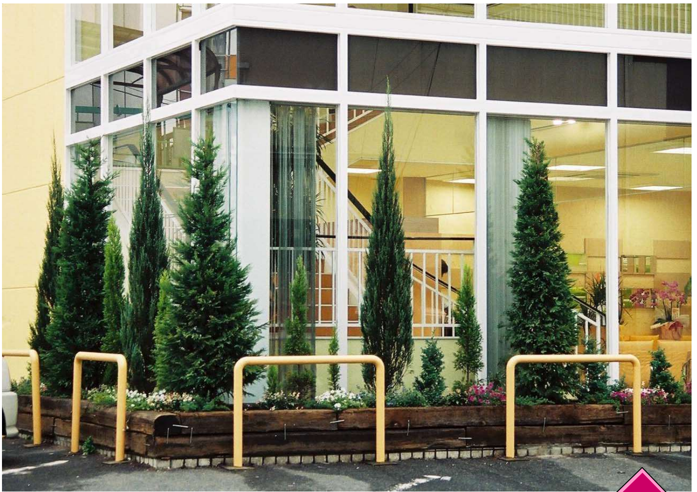
コニファーの枕木花壇(マザーポット自動給水) 2002.10 P美容院(一宮市)