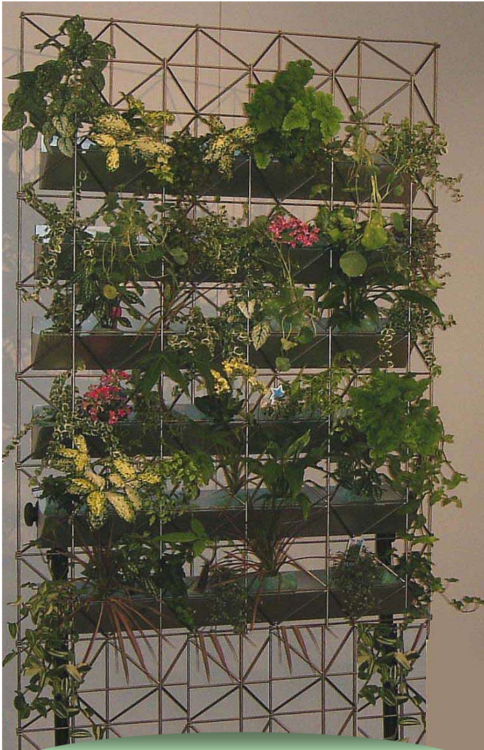
可動式フェンス緑化