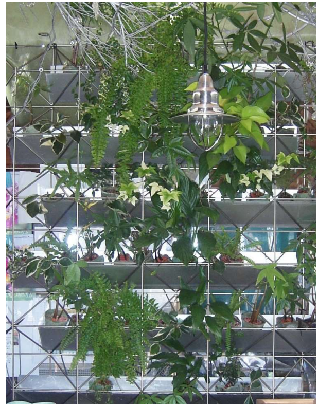
ジェイアール東海ナゴヤタカシマヤ11F & てるかガーデンデザインに展示中